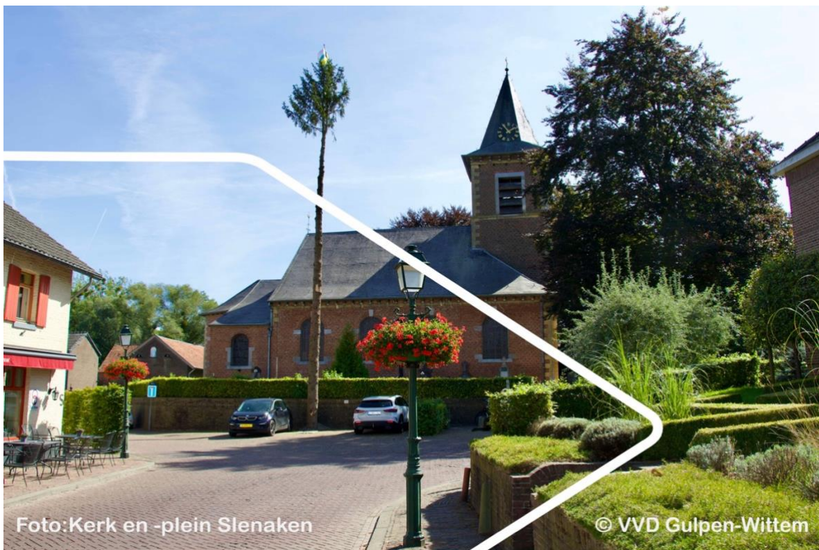
Foto:Kerk en -plein Slenaken

Wij zullen geen grote projecten starten zonder aantoonbaar maatschappelijk nut, draagvlak en een sluitende begroting (als onderdeel van een haalbaarheidsonderzoek). Elk plan boven een bepaald bedrag leggen we voortaan eerst voor aan de raad én inwoners. Wij investeren liever in voor leefbaarheid noodzakelijke voorzieningen dan in slecht doordachte projecten.